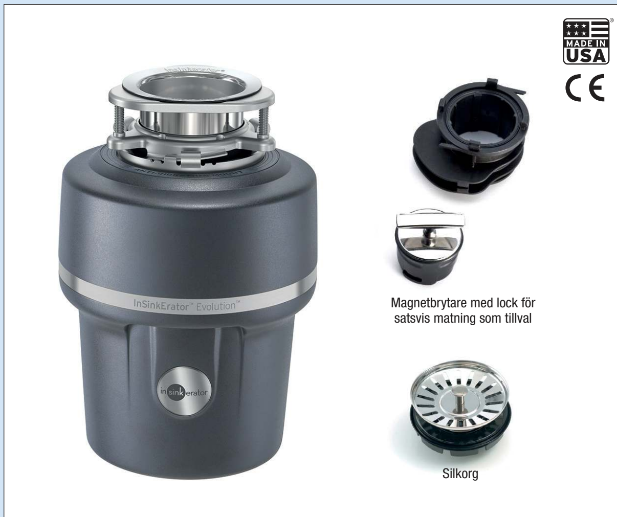
Magnetbrytare med lock för satsvis matning som tillval