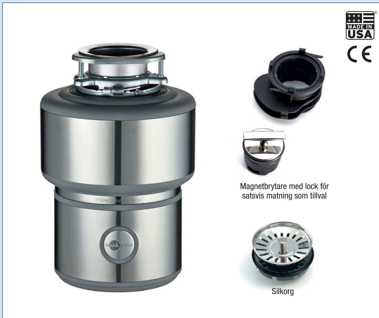
Magnetbrytare med lock för satsvis matning som tillval